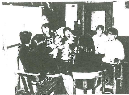
「くつろぎタイム」の様子。おしゃべりを楽しむ