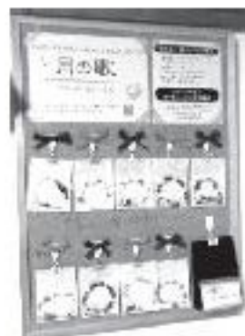
ギャラリーの作品も お店に並ぶよ!!

参加申し込みは、9月20日(木)までです。興味のある方は、スタッフまで声をかけてくださいね。