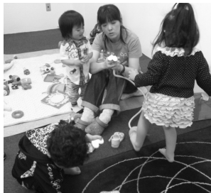
▲「HAPPY MEETS×ママまつり」の説明会で、出張保育しました。