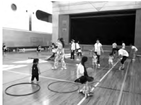
新聞ビリビリ・バラバラ。みんなでやるとテンション上がります! いろんな遊具もみんなで出して思いっきり遊べます。