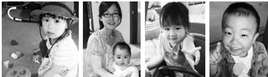
帽子が素敵なみづぎちゃんは、いちかちゃんのお姉ちゃん ひのわちゃん運転中 1等賞? あゆむくん