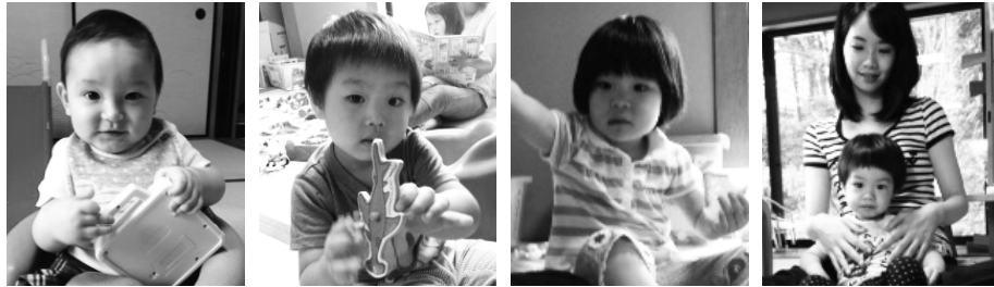
カメラ目線のジョシュア シャークを持って、セナくん ラスクおいしい!あかりちゃん ママ大好き♡琥太郎くん