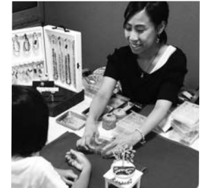
beads Yuu さんのワークショップは、毎回、子どもたちにも大人気♪

今回は、初出展の方がおふたりも。お客様だけでなく、出展者同士も「脳リラクゼーションって何?」「シートヒーリングって、どんなヒーリングですか?」「耳ツボジュエリー、私も体験してみたい〜」と、ワイワイ盛り上がった1日となりました。