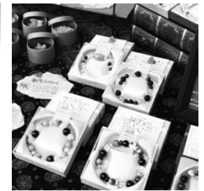
月の歌さんは、天然石や屋久杉ビーズを使った作品の販売も。