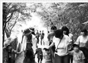
ジュニアの親子も がんばって 登りました!