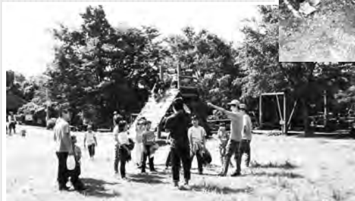
下山するまで「広場であそびー!