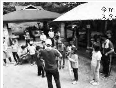
今から頂上めざして スタートです!

また、今年は星のミュージアムの展望台から、火星や土星を見せて頂きました。金剛山から見る星空は最高にキレイでした。