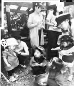
就園前の子どもたちも 楽しんでます♪